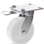
FLK.GMK - F5