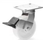
FLM (até 8'')