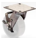
PLK - F3 (até 8'')