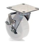
PLK - F3