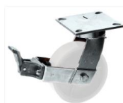
FLK - F6