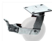
FLK - F6