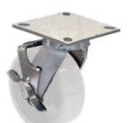
PLK - F3