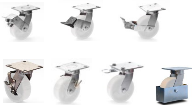
PLK - F3