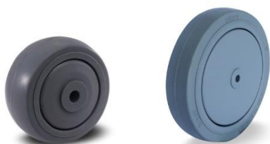
RODA 312 e 612 – BANDA RETA

Rodízios para cargas leves em móveis e acessórios de utilidades para o comércio, indústrias e centros logísticos.