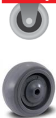
RODA 312 – BANDA RETA