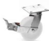
FLK - F6