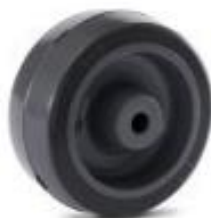
RODA 312 – BANDA RETA